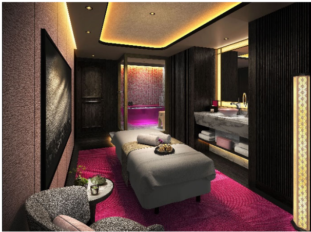
スパ / トリートメントルームイメージ