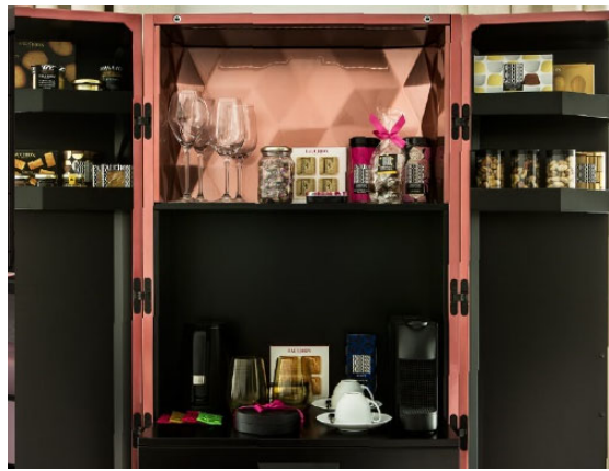
グルメバー / イメージ

また、「ファッションホテル パリ」で展開し人気の「Gourmet Bar / グルメバー」を全客室に設置。シャンパンピンクに輝くクローゼットの中には、ファッション自慢のスイーツやペストリー、紅茶などをご用意いたします。お部屋でのティータイムやディナー後のデザートとして、ご滞在中自由にお楽しみいただけます。旅の思い出のひとつとしてお持ち帰りも可能です。