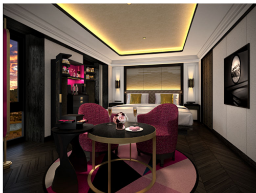
スーペリアルーム / イメージ