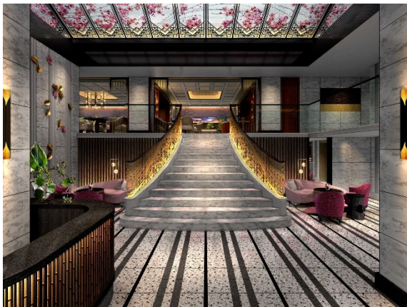
1F 大階段 / イメージ