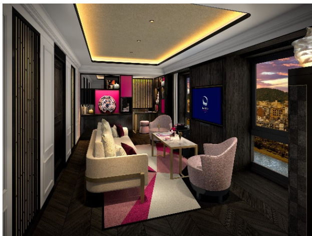
プレステージスイート / イメージ