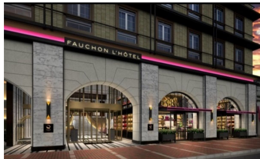
外観 / イメージ