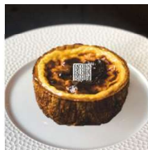
Flan フラン (金・土・日のみ)

フランスのクラシックなフランを、 より滑らかに仕上げました。 プリンタルトのような印象のケーキです