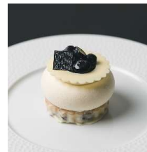
Mousse myrtille ムース ミルティエユ

ブルーベリーのフィナンシェと砕いたアーモンドが ホワイトチョココーティングされた上には フロマージュムースとブルーベリーを