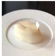
Bisou Bisou caramel ビズビズ キャラメル