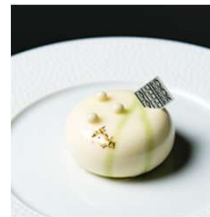
Le muguet ルミュゲ

すずらの香りのホワイトチョコムースの中に ピスタチオのクレムーとグリオットチェリーのジュレ