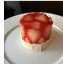
Fraisier フレジエ (~5/6まで)

旬の苺とベルベヌ(レモンバーベナ)の ジュレの中にクレームムーススリーヌ カスタードクリームにバター