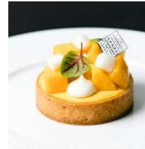
Tarte au mangue-yuzu タルト マンゴー・ユズ(5/6から)

アーモンドクリームの上にマンゴーユズの クリームとフレッシュなマンゴー ユズのギモーヴがのったタルト