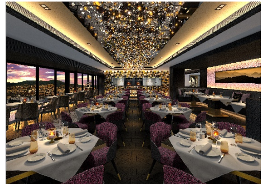
「Restaurant Grand Café Fauchon」内観イメージ

四季折々の旬の野菜を中心に、大豆製品などを使用し、洗練された風味豊かな料理を楽しむことができる京料理と、世界三大料理の一つであるフランス料理は、素材の最高の味を引き出すこと、見た目の美しさへのこだわり、五感すべてで楽しめる点など共通点が多くあります。