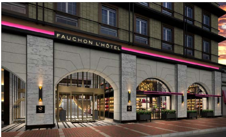
ホテル外観イメージ