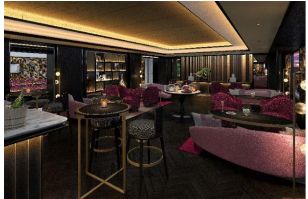
レセプションイメージ

フォション ロテル パリで提供している貸し切りボートによるセーヌ川散策やディナークルーズと同様に、フォションホテル京都でも、京都の伝統的な名所として愛され続けている鴨川をよりお楽しみいただけるプランも予定しております。