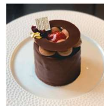
Cerise fraise & chocolat チェリーベリーチョコレート (金・土・日のみ)

サクサクしたビスキュイショコラに チェリーベリームース その中にはチョコレートクリームと苺のジュレ