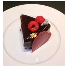
Mousse Chocolat Framboise ムースショコラフランボワーズ

フランボワーズとチョコレートのムース フォンダンショコラをチョコレートで コーティング