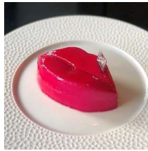
Bisou Bisou mint & strawberry ビズビズ フレーズミント