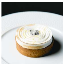
Tarte citron タルト シトロン

香ばしく焼き上げたガレットブルトンヌ生地の上 に程よく酸味を効かせたレモンクリームと メレンゲをトッピング